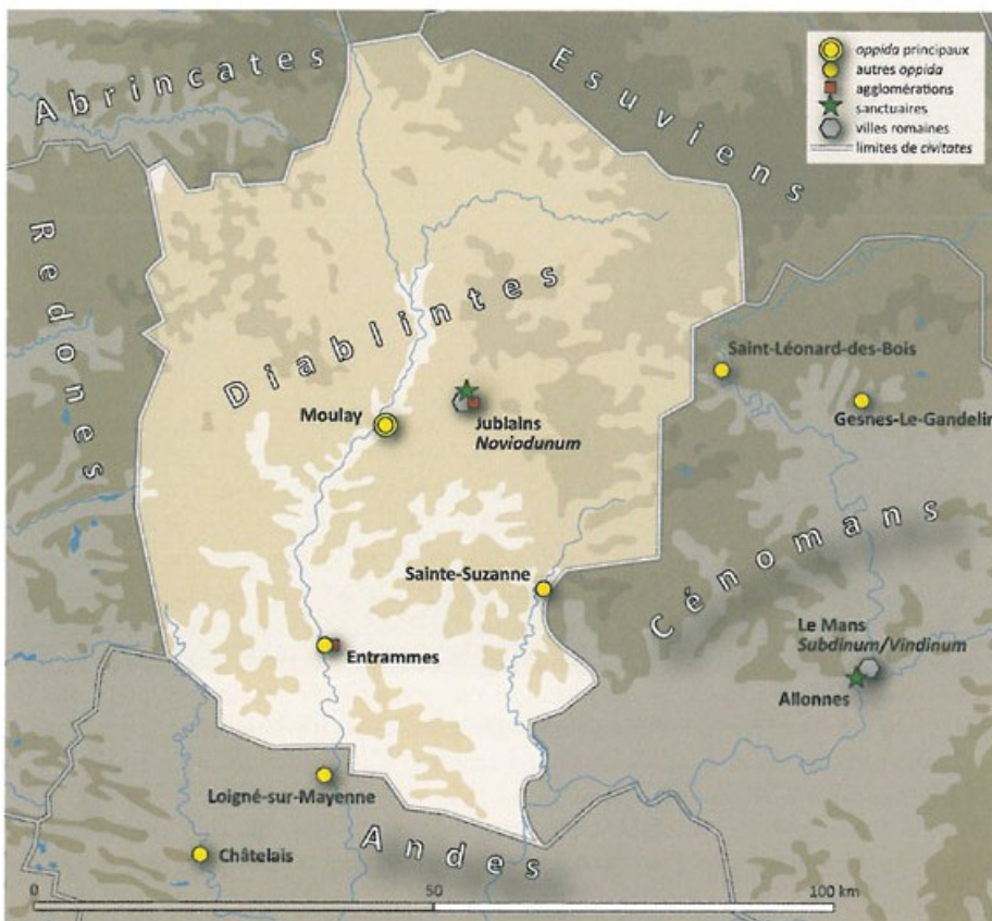
Carte de la civitas des Diablintes.