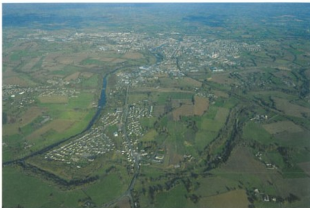
Vue aérienne de l'oppidum diablinte de Moulay

Tout d'abord, la civitas gauloise est principalement une notion politique, d'où la prudence dont il convient de faire preuve avec les « réalités archéologiques, issues de la culture matérielle ». En outre, la civitas gauloise est une entité territoriale bien identifiée. Certes, si l'on a encore comme représentation celle d'un peuple « barbare », on peut difficilement imaginer qu'une organisation stricte, avec des frontières bien définies, puisse exister avant l'arrivée des Romains.