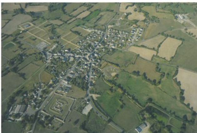
Vue aérienne de la ville romaine de Jublains